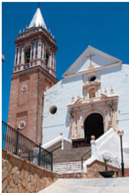
Arriba, panorámica de Ardales al pie de la fortaleza. Debajo, la iglesia de los Remedios y entorno del municipio, situado en la zona de los pantanos del Chorro y Guadalhorce.

A l pie de una gran peña que albergó un poderoso castillo, Ardales despliega toda su hermosura de pueblo andaluz con calles estrechas y sinuosas, casas blancas encaladas y balcones floridos. Muy cerca del río Turón y a caballo entre la Serranía de Ronda y la depresión de Antequera, este municipio de Málaga tiene en su paisaje variado de montaña y meseta uno de sus grandes encantos.