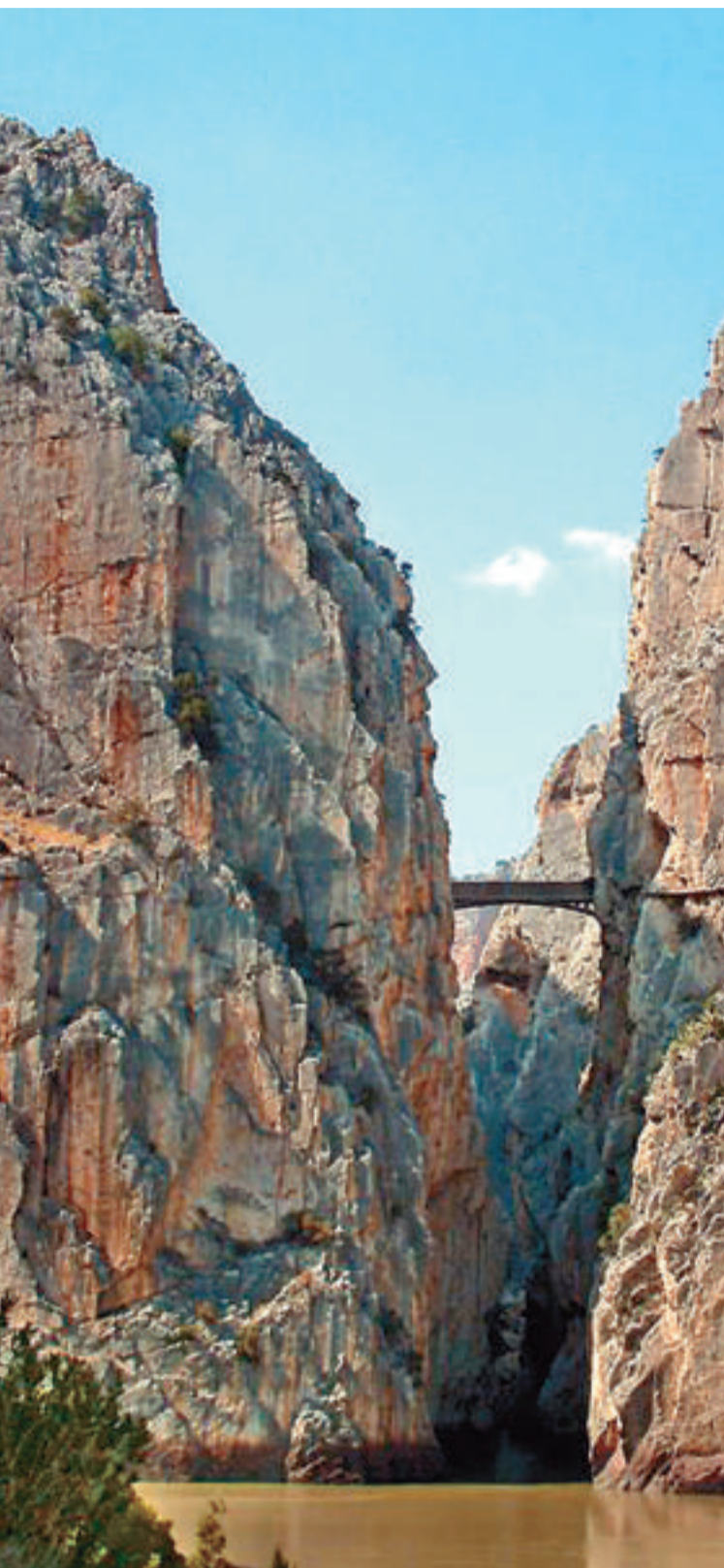
El desfiladero de los Gaitanes es uno de los muchos atractivos naturales de este pueblo malagueño. Al lado, un balcón florido en una calle de la villa, la Cueva de Ardales y practicando montañismo.