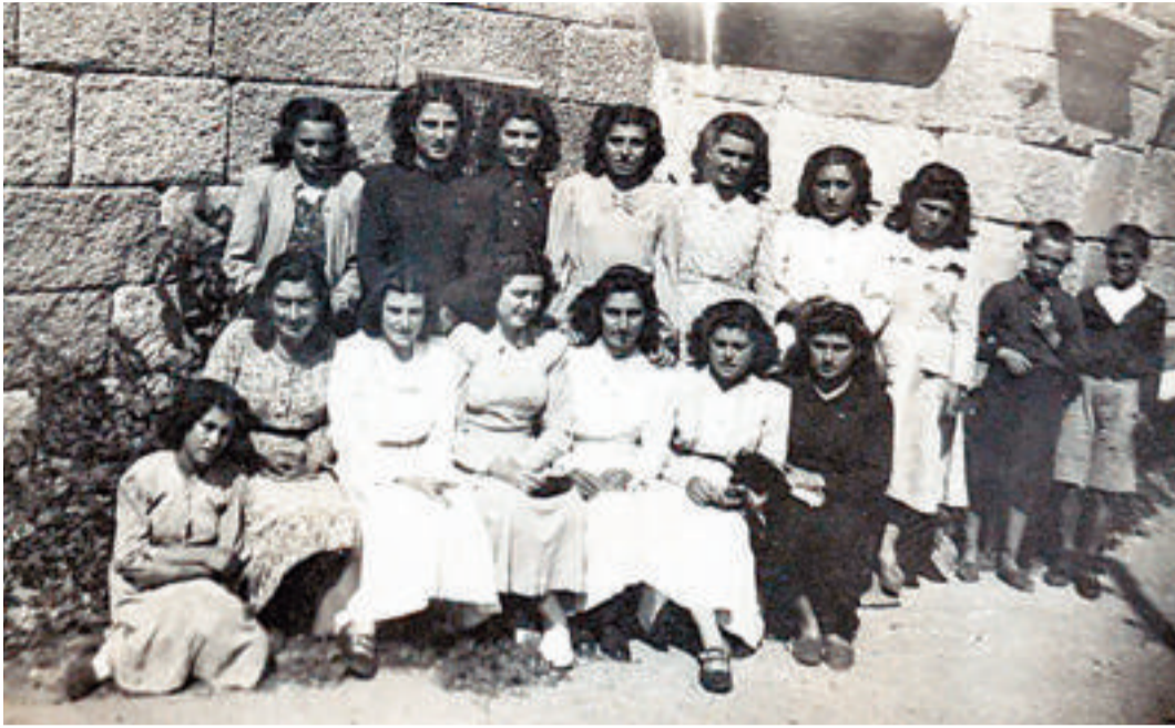
A la izquierda, un grupo de jóvenes delante de la iglesia de Alberguería, la construcción que fue trasladada piedra a piedra. Al lado, una reunión de mozas, muchachas pastoreando en los años 50 y asistentes a