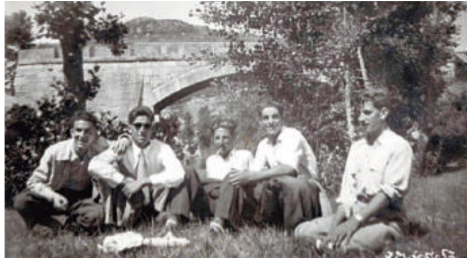
Sobre estas líneas, un grupo de mozos posa ante el puente medieval de Alberguería en 1953. Al lado, varios vecinos recuperando material de las casas antes del anegamiento. La foto es de 1957.