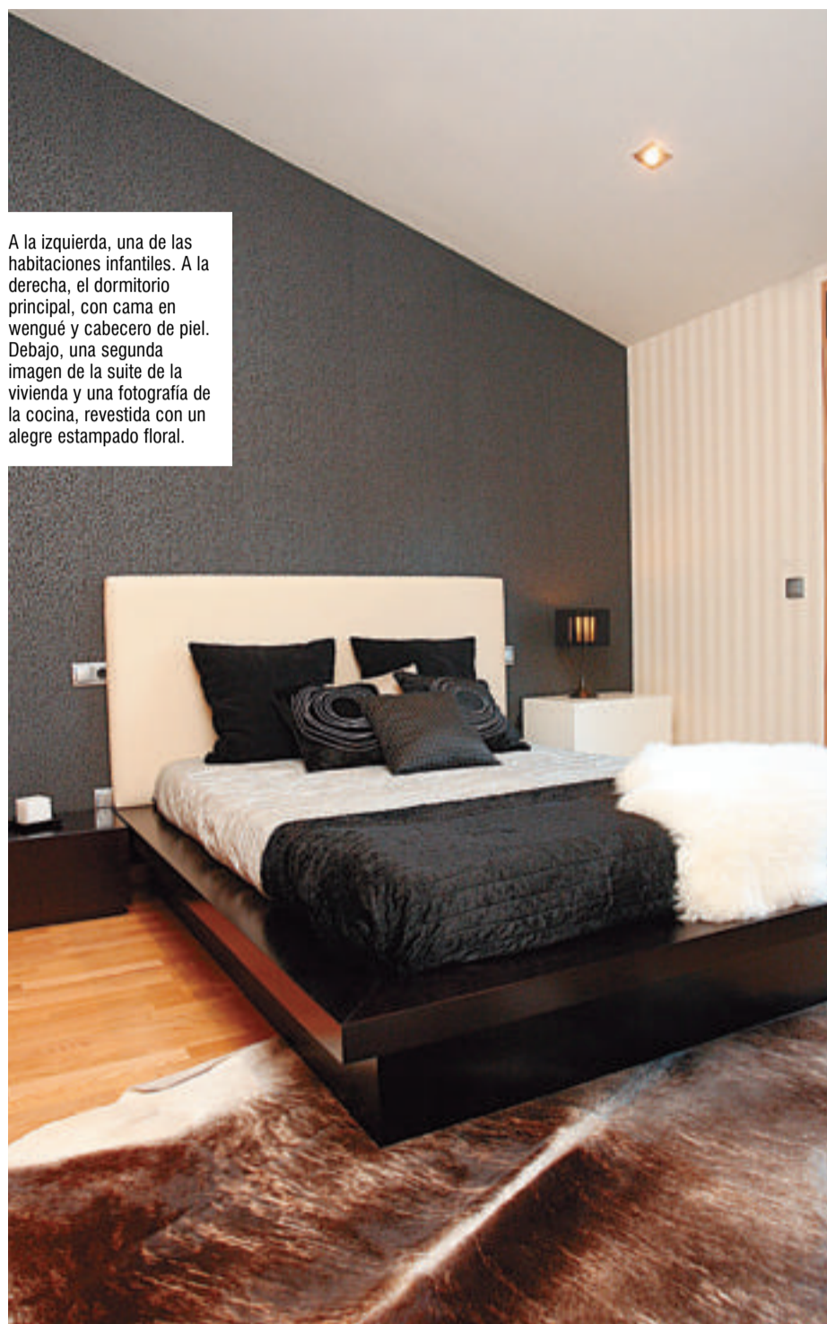
A la izquierda, una de las habitaciones infantiles. A la derecha, el dormitorio principal, con cama en wengué y cabecero de piel. Debajo, una segunda imagen de la suite de la vivienda y una fotografía de la cocina, revestida con un alegre estampado floral.