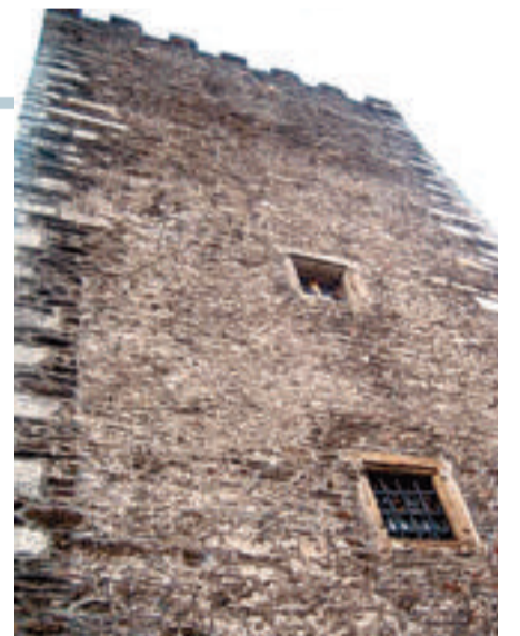
Arriba, la Torre del Homenaje. A la izquierda, una de las salas del museo etnográfico.

de ferreiro o el zoqueiro, además de los utensilios para el trabajo del lino y de la lana, manufactura de gran tradición en la zona. Pueden verse ropas, colchas y mantas, además de los enseres de la vida doméstica en el cuarto y la lareira, recreados al detalle con el pote y la gramalleira, la