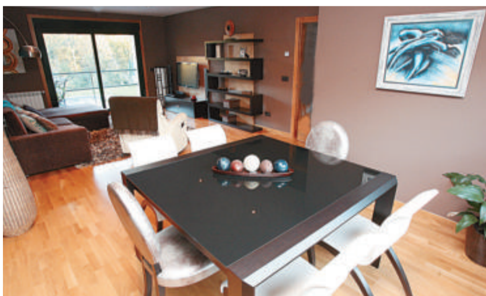
Sobre estas líneas, el estar, dotado de un sofá con chaise longue y una butaca en blanco. A la izquierda, panorámica de toda la estancia desde el comedor. Bajo estas líneas, otra fotografía en la que se aprecia uno de los papeles utilizados. Más abajo, la piscina y el jardín trasero de la vivienda.